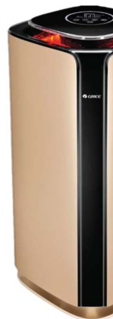
Замърсен вт PM = 2.5 > 115