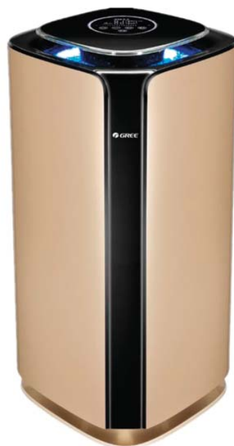
Нормален въздух PM = 2.5:36~115