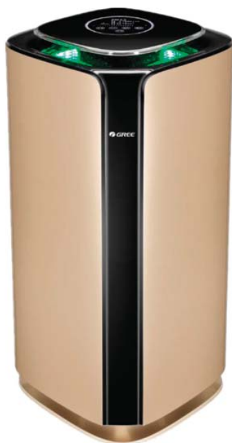
Пресен въздух PM = 2.5 < 35

3 цвята за 3 различни стойности на качеството на въздуха